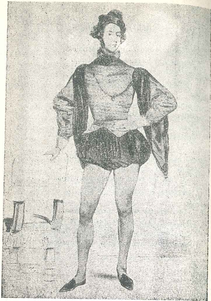
Alfred de Musset